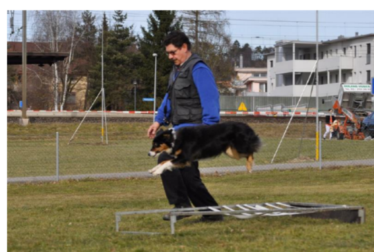
BH-Training 2010 (Sprungfestival)