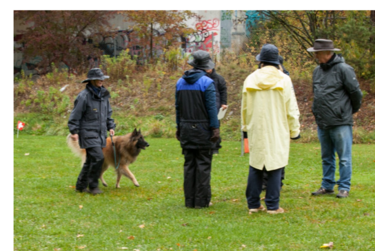
Interne BH-Prüfung 2018