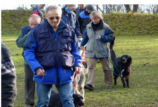
Impressionen Training Begleithunde 2009 (Dieser Bildbericht vermittelt einen Einblick in den BH-Trainingsalltages)